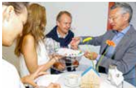
Breakfast Club Wien

Der Breakfast Club findet in jeder Region (Wien, Graz, Salzburg, Innsbruck) vier Mal im Jahr statt. Als Breakfast Club Member der jeweiligen Region kann man sich mit einem Clubbeitrag von € 240,-/Jahr mit anderen Unternehmen vernetzen und das jeweilige Kinderhilfe Haus in der Region unterstützen. Der Clubbeitrag ist als Spende steuerlich absetzbar. Alle interessierten Unternehmen und Privatpersonen können sich unter www.kinderhilfebrokefastclub.at anmelden.