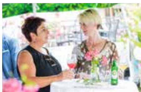
Breakfast Club Salzburg