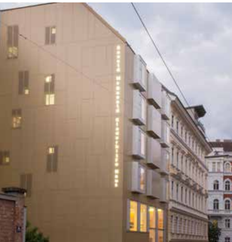
Ronald McDonald Haus Wien Borschkegasse

Das frisch eröffnete Gebäude bietet über acht Geschosse, 16 Appartements, Gemeinschaftsräume für spielerische Aktivitäten, eine Küche mit Essbereich , sowie einen in Terrassen angelegten Garten zur gemeinsamen Nutzung .