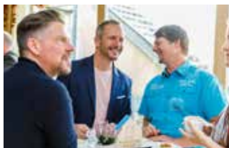
Breakfast Club Innsbruck