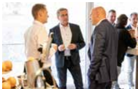
Breakfast Club Graz